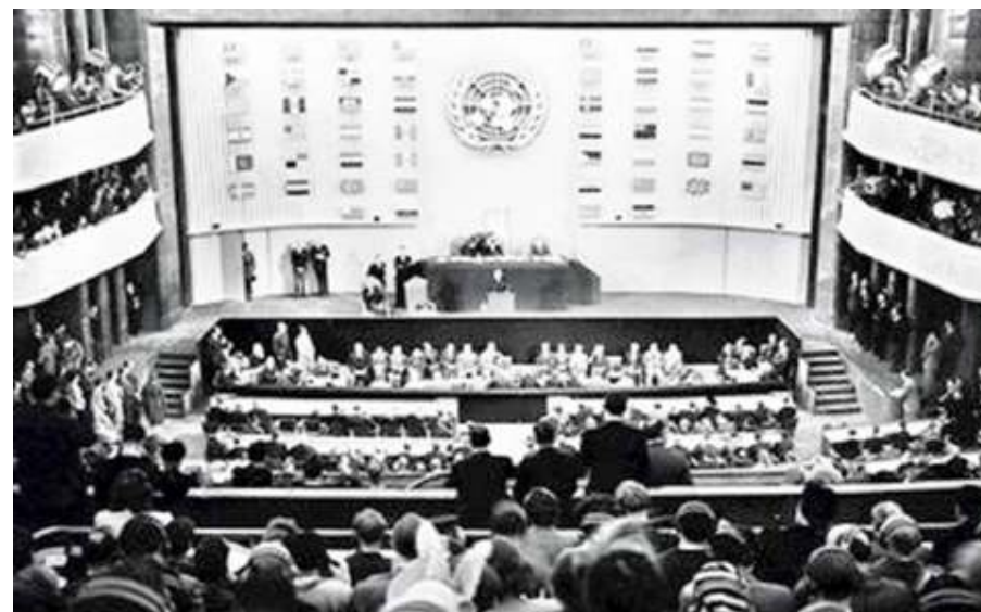
Plenaire vergadering van de Verenigde Naties bij de universele verklaring van de rechten van de mens op 18 december 1948

Art 1. Elke mens wordt vrij en gelijk in waardigheid en rechten geboren.