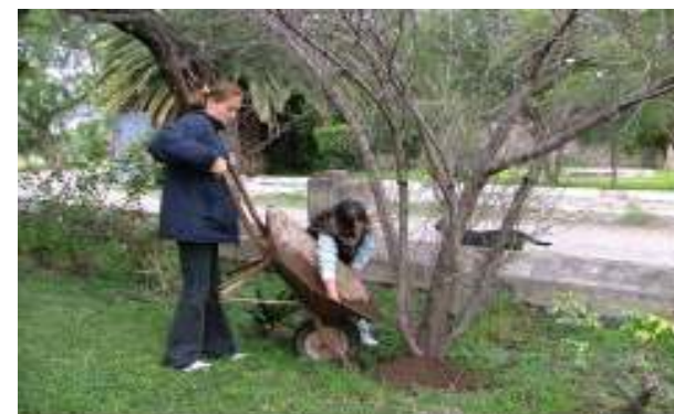
Opgespaarde compost wordt rond de bomen verspreid.

Composteren wordt veel besproken en toegepast in Ex Hacienda. Tijdens meerdere cursussen voelde Frans ook bij de cursisten de betrokkenheid op het milieu. Ook dat aspect zit reeds lang in zijn handboeken verwerkt.