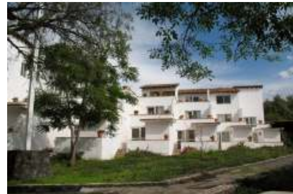
Algemeen zicht op de KIBBUTZ