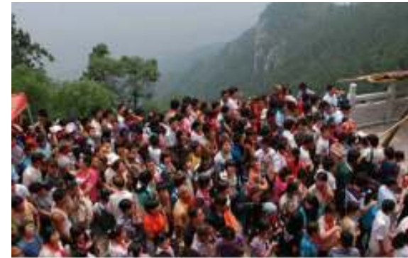
Groep cursisten in een bergstreek

Art 30. Niemand: staat, groep of persoon mag deze rechten beknotten.