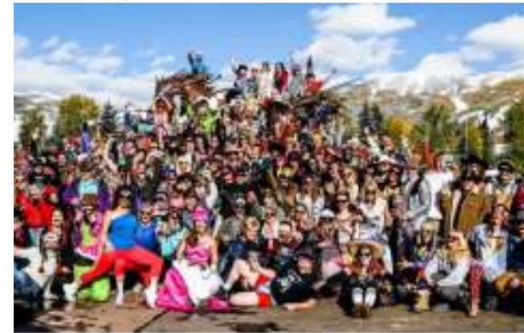
Bij het einde van een cursus